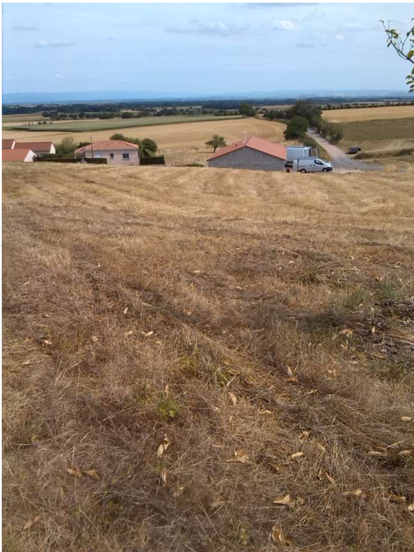
Vue des terrains des Châtaigniers : Vue panoramique sur les Monts du Forez.